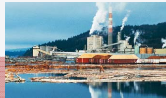
Управление на околна среда