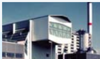
Отпадъци и рециклиране